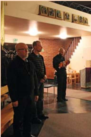
Andreas Kreetalaisen katumuskanoni toimitettiin keskiviikkoiltana 5.3. Nurmeksen kirkossa.