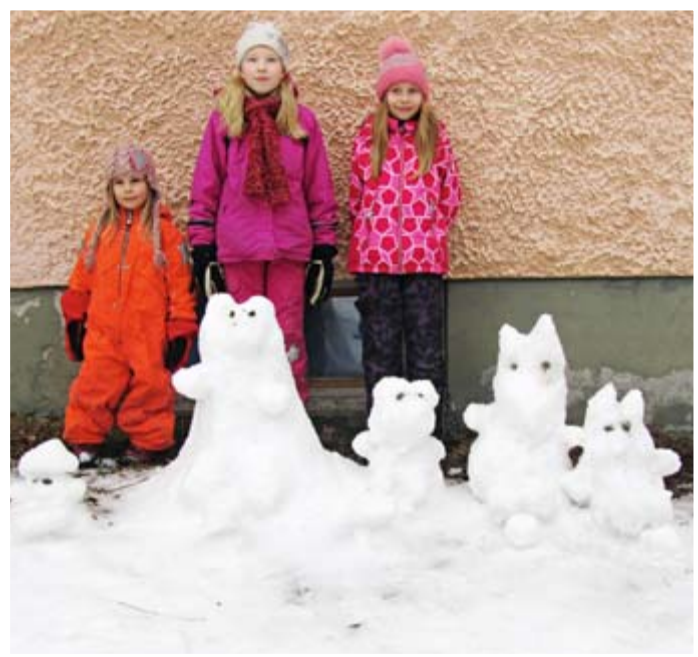
Lumiveistoskilpailun voittaneet taiteilijat ja voittajatyö nimeltä "Eläinten kokous".