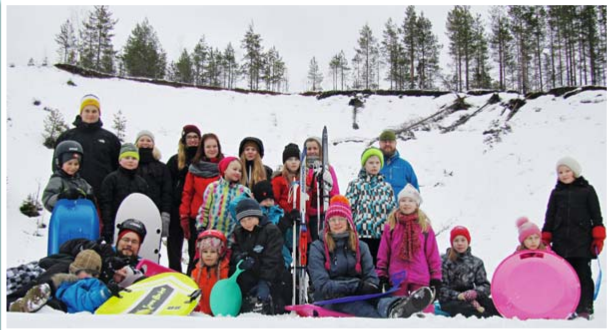
Mäkeä päästiin laskemaan koko leirin vahvuudelta, vaikka talvi onkin ollut vähäluminen.