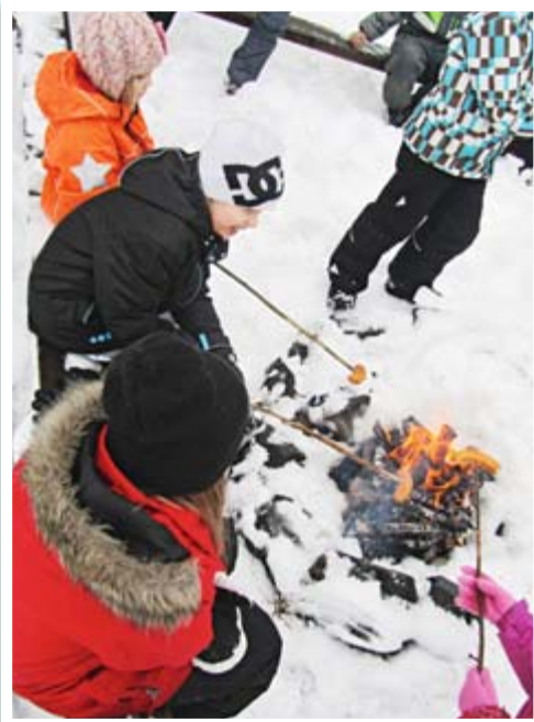
Leiriohjelmaan kuului makkaran paistoa nuotiolla.