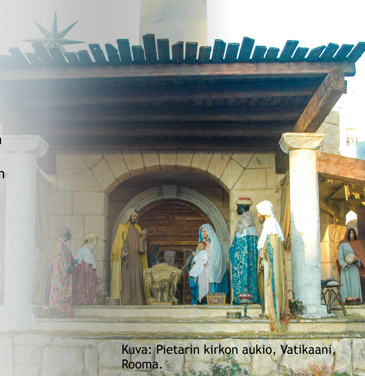
Kuva: Pietarin kirkon aukio, Vatikaani, Rooma.