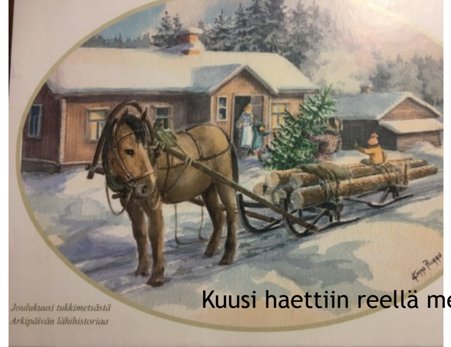
Joulukuusi tukkimetsästä Arkipäivän lähistoriaa