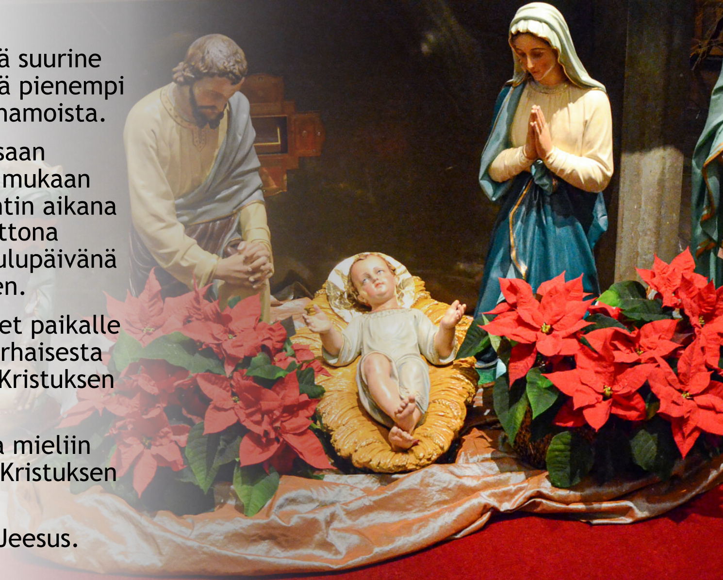
Kuva: Pyhän Henrikin katedraali